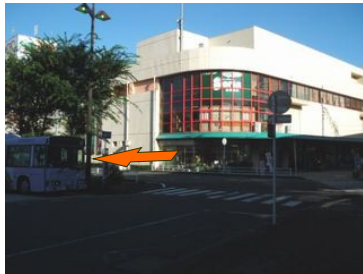
②駅前の平和堂 夏場は朝9:00にOPENします