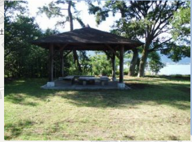
屋根付きのベンチが有ります