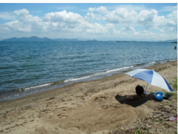
砂浴は・・・ こんな感じで潜ります

車なら・・・北大路駅～途中～和邇駅(27キロ/約1時間) 山科駅～湖西道路～和邇駅(25キロ/約45分) 駐車は「平和堂の駐車場」を利用させて頂きましょう