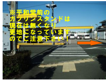
④交差点の信号を渡って右へ