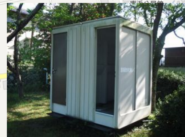
仮設トイレが常設されています