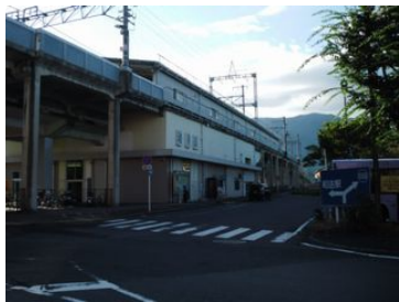
①和邇駅前 (写真右がロータリー=集合場所★)