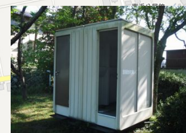
仮設トイレが常設されています