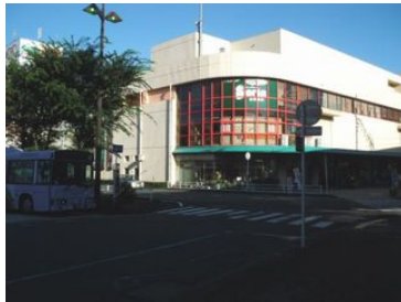
②駅前の平和堂 (写真右のバス裏がロータリー)