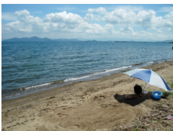
砂浴は・・・ こんな感じで潜ります

車なら・・・北大路駅～途中～和邇駅(27キロ/約1時間) 山科駅～湖西道路～和邇駅(25キロ/約45分) 駐車は「平和堂の駐車場」を利用させて頂きましょう