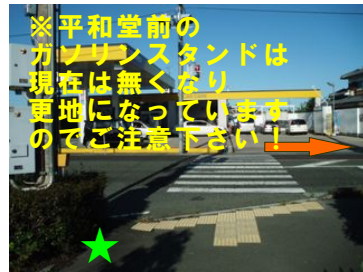
④交差点の信号を渡って右へ ※平和堂に車で来られた方はココ★に集合