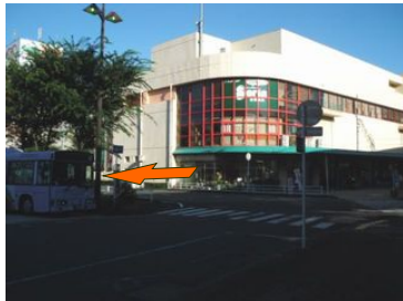
②駅前の平和堂 夏場は朝9:00にOPENします