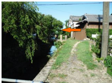
⑦農道をそのまま歩くと・・・ 一般道に合流します(橋を左折)