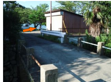
⑧橋渡ると、直ぐに倉庫があるので その先を浜に降りると・・・到着!