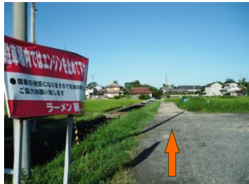
⑥駐車場をそのまま小川沿いに 農道を真っ直ぐに進む