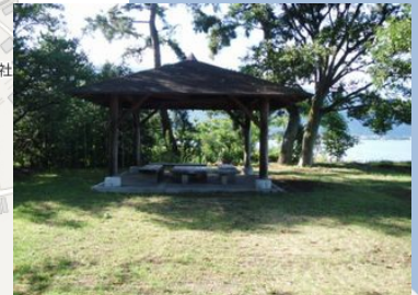
屋根付きのベンチが有ります