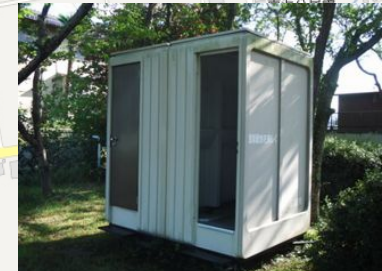
仮設トイレが常設されています