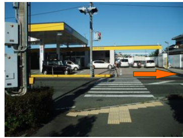
④交差点の信号を渡って右へ