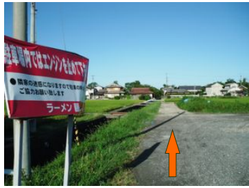
⑥駐車場をそのまま小川沿いに 農道を真っ直ぐに進む