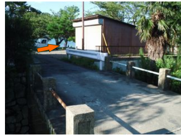
⑧橋渡ると、直ぐに倉庫があるので その先を浜に降りると・・・到着!