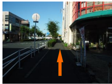
③和邇浜へは・・・ 平和堂沿いの道を真っ直ぐ交差点へ