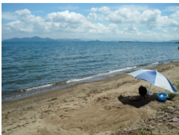
砂浴は・・・ こんな感じで潜ります

車なら・・・北大路駅～途中～和邇駅(27キロ/約1時間) 山科駅～湖西道路～和邇駅(25キロ/約45分) 駐車は「平和堂の駐車場」を利用させて頂きましょう