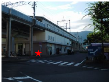
①和邇駅前 (写真中央左の★が集合場所)