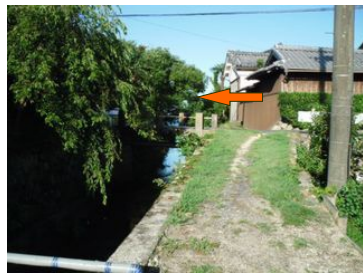
⑦農道をそのまま歩くと・・・ 一般道に合流します(橋を左折)